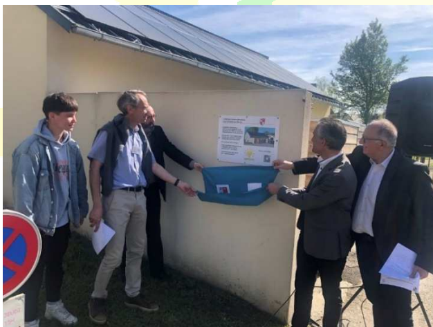
Inauguration de l'installation PV du bâtiment technique de La Vicomté-sur-Rance

Deux autres installations (Lancieux et Pleslin-Trigavou) sont en cours de réalisation et vont être raccordées en cours d'année. Nous atteindrons ainsi une puissance de 305 KWc. Beau résultat dont nous pouvons nous féliciter !